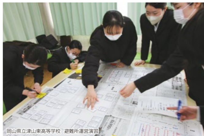
岡山県立津山東高等学校 避難所運営演習