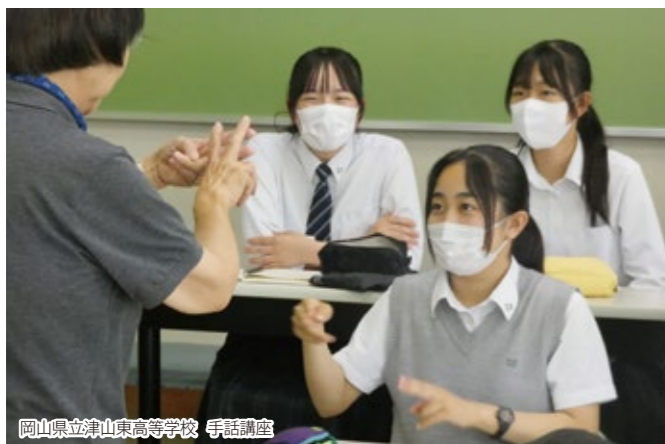
岡山県立津山東高等学校 手話講座