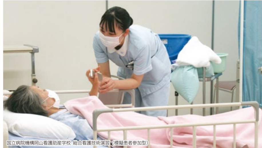
国立病院機構岡山看護助産学校 総合看護技術演習（模擬患者参加型）