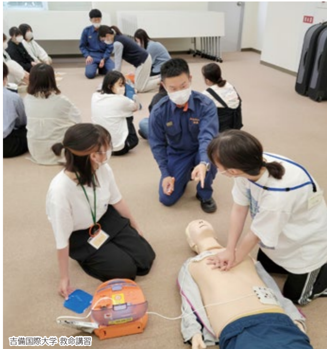
吉備国際大学 救命講習