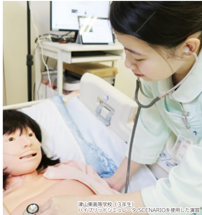
津山東高等学校（3年生） ハイブリッドシミュレータ SCENARIOを使用した演習