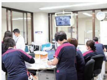
朝のチームカンファレンス

整形外科と内科の診療科をもつケアミックスの病院です。一般病棟では、整形外科の手術前後の看護、リハビリ、急性期病院から転院を受け入れ継続看護をしています。また、地域包括ケア病床では医師、MSWやリハビリ職員とともに、在宅復帰支援に取り組んでいます。療養病棟では長期入院の患者様、ご家族が、少しでも安心・安楽で過ごせるよう、ケアの充実に取り組んでいます。関連施設に、老健、特養、サービス付き高齢者向け住宅、訪問看護などがあり、「患者様が安心して医療を受けることができるやさしい病院」をめざしています。