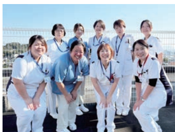
「淳風会リクルートサイト」もご参照ください

多職種と密に連携を図り、チーム医療を実践しています。患者様一人ひとりに最善のケアを提供するべく、ケースカンファレンスやNSTカンファレンスを毎週開催するなど、職員全員で患者様をサポートしています。