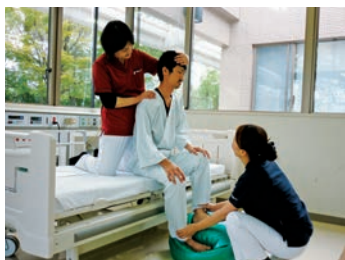
療護看護プログラム

岡山療護センターは、自動車事故による脳損傷で遷延性意識障害となった方を専門に治療する病院です。国土交通省が所管する自動車事故対策機構が全国4カ所に療護センターと委託病床8カ所を設置(全315床)。そのうちの一つが当センターです。日本以外にこのような交通事故患者専用病院はありません。患者さんの僅かな反応も見逃さない観察・看護を行うため、実際の体制は患者1人に対し看護師1.3人程度としています。重度意識障害となった患者さんを人として尊重し、生きる力を支える看護、残された能力を最大限に発揮できる看護を実践しています。