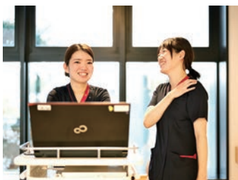
笑顔あふれる明るい職場です

保育料補助・子ども行事のための希望休・家族の急病などにも柔軟な対応はお互い様の気持ちが満載です。有給休暇は入社後2か月経過後から10日付与されています。