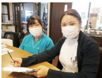
入職5年目 チームと共に成長しています！

新採用の方が、安心と自信を持って看護提供ができるよう、プリセプターが1年間、相談・指導にあたります。クリニカルラダーに基づく集合教育を通じて、自主的に、自分のペースで、自己の能力を伸ばしていきます。看護研究も活発に行っています。