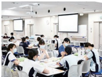
フォローアップ研修Ⅰ

質の高い(安心・安全・安楽な)看護サービスを効果的(Effectively)に、効率的(Efficiently)に、倫理的(Ethically)に、エンパワメント(Empowerment)を通して提供する。