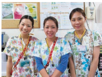
プリセプターは頼れる存在です

当院は44床の回復期リハビリテーション病棟です。患者さん一人ひとりに対し個人サポートチームを結成し、各職種が専門性を活かしながら、同一の目標に向かって患者さんのサポートをしていきます。看護師は患者さんが安心して、リハビリができるよう全身管理を行っています。また日常生活全てがリハビリテーションとなるように、患者さん個々の能力に合わせて援助を行います。退院後の生活を具体的にイメージして早期より退院支援に取り組んでいます。