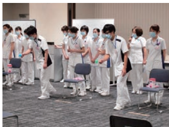
競技を通してチームワークの大切さを学びました！

患者さんやご家族の幸せは、あなたの幸せにもきつとつながります。私たちと一緒に、心に寄り添う看護をしていきませんか。