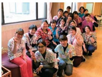
明るく元気な職場です

新人看護師(プリセプティ)には、先輩看護師(プリセプター)がついて業務を教えてください。プリセプターは、わからないことを丁寧に教えてくれるだけではなく、精神面もサポートをしてくれます。病棟全体でプリセプティを育てる意識を持ちながら、成長を見守っていきます。