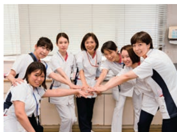
私たちと一緒に働きましょう

術前・術後・がん化学療法・ターミナルケア等さまざまな場面で患者様と関わる中、スタッフ間での伝達・報告・相談ができる頼りになる仲間がいます。新人看護師も中途採用者の方も担当の指導者が中心となりチーム全員でサポートしています。