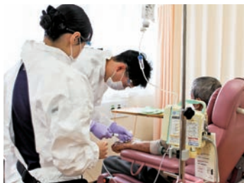
研修と実践の統合を教育の基盤にしています

当院は、急性期高度医療を診療の軸として、臨床研究、教育・人材育成に力を注いでいます。そして地域医療支援病院、総合周産期母子医療センター、地域がん診療連携拠点病院として、総合的で高度な急性期医療を提供しています。また岡山市の委託を受けて金川病院(地域包括ケア病棟)を運営しています。看護部では、専門性の高い看護師の育成を目指し、看護部長・副看護部長が中心となり研修と臨床実践を統合させ、学びあい、看護の心をより豊かに育めるように支援しています。