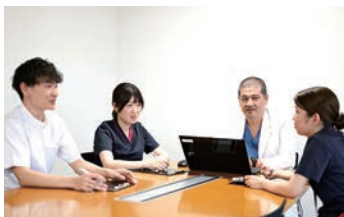
他職種と連携した合同カンファレンス

職場内においては、職員相互の信頼と協調により明るく働きやすい魅力ある職場作りを行っています。