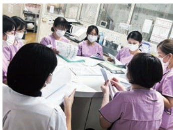
日々の悩みが少しでも解消できるよう皆で意見交換をしながら勉強会を開催しています

そして看護部は、「患者様への思いやりを重視した看護」を目標に、いつも笑顔を忘れず、患者様お一人お一人の声に耳をかたむけながら、心がかよう看護を行っています。