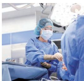
一緒に働きましょう

パートナーシップナーシングシステムを導入し、ベッドサイドでケアと記録を効率的に行っています。患者さんとの関わりも増えてやりがいがあります。お互いを認め合い、学び合う風土が定着している当院看護部に適した仕組みです。