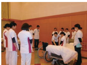
互いに育ち合える仲間

認定看護師・特定行為研修終了看護師が現場で専門分野の教育・指導・支援を行い、看護の質・現場の実践力向上に日々取り組んでいます。また、認定看護師資格取得・特定行為研修の支援・学会参加の支援等、自己研鑽に励みやすい環境です。