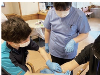
先輩と一緒に注射の練習中!

新人看護師へは3年間の研修計画を作成し、育成に取り組んでいます。職員全般の福利厚生なども充実しています。また、公認心理士による精神的支援が受けられるEAP制度もあります。職員が長く働き続けられる環境づくりを行っています。障がい者のための制度改善の取り組みも行っていきます。