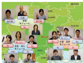
地域生活を支える鹿田丸訪看ステーション

新任者(プリセプティ)1人に先輩看護師がチーム(プリセプター・エルダー・サポーター・コーチ)で支援します。1年の振り返りの会では、先輩たちからの成長を喜ぶメッセージを受けて、照れたり、泣いたりしながら、自信と先輩になる自覚を持ちます。