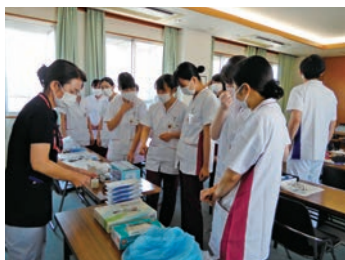
認定看護師が活躍しています

当院は、脳・神経・運動器の総合的専門病院です。私達は、病院の理念を基盤に各部署の課題達成に向け年間計画を立て、全員が同じ目標に向かって取り組んでいます。看護部の理念は「専門職として知識・技術の向上に努める」、基本方針は「すべての人に心をこめた専門性の高い看護」です。また 看護部のキャッチフレーズとして「看護という感動と一緒に」を掲げ看護を行っています。そして一人一人が幸せでやりがいのある、働き続けられる病院をめざし、職場環境の改善・整備に取り組んでいます。