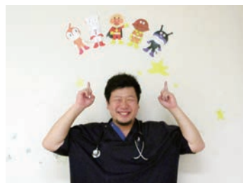
家庭でも職場でも笑顔で過ごせます

また、当院は研修への参加も積極的に支援しています。勤務体制はライフスタイルに合わせて勤務時間の調整を行い、働き続けられる職場環境づくりを行っています。