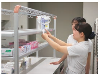
二人一組でケアを行います

当院は「地域住民に信頼され、安全・安心を提供できる病院」として急性期から在宅療養までをトータルに支援できる取り組みを行っています。看護部の理念である「私たちは、対象者となる人々が自らの持つ力を発揮し『自分らしく生きる』を支えます」を信条に、専門職者として正確な臨床判断と看護実践能力が発揮できるように、クリニカルラダーを基盤にした次世代の学習支援システムを整え、自らが目指す看護師となるように支援しています。また、子育て支援・就労継続支援に取り組み、ワーク・ライフ・バランスを充実させています。