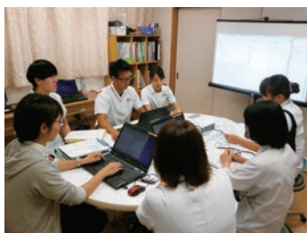
カンファレンスの様子

院内研修は勤務時間内に行われ、看護部の研修は年間を通して計画されています。回復期リハビリテーション各専門職からの様々な学びや、クリニカルラダーに沿った教育が行われています。個々のスキルアップ、キャリアアップのために院外研修への参加支援も積極的に行っています。