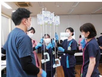
先輩看護師が丁寧に教えます

しっかり基本が身に付くよう、メンター(プリセプター)、実地指導者、エルダー(教育担当者)、師長、教育師長がみんなで見守り、年2回の臨床心理士による面談など、新人看護師をサポートする体制を整えています。また、認定看護師や各学会認定指導士などの資格取得支援制度もあります。