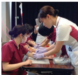
新人看護師研修の様子

私たちは、理念である「その人らしく生きる」を大切にした看護を提供しています。ケアは看護師の小さな「気づき」から始まるため、ベッドサイドで「患者さんに関心を寄せる」ことが重要だと考えています。そのため、ステーションを起点とする従来の提供方式ではなく、ベッドサイドで仕事ができるセル看護提供方式の導入を進めています。また、患者さんだけでなく、当院の看護師が「その人らしさを発揮」することも大切にしています。一人の看護師が見つけた小さな気づきを、部署全体が大切にできる職場であり続けたいと思っています。