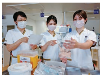
医療安全対策 強化中です!

当院は国内でもトップレベルを誇る循環器専門病院です。医師・看護師・コメディカルがチーム一丸となって安全で質の高い医療サービスを提供するため日々努力しています。eラーニングでの学習システムを導入しており、知識の統一やマニュアル改訂などエビデンスを持った看護実践にも繋がっています。症例数も多く、循環器疾患領域を学びたい人・やる気がある人にとっては多くを学べる環境であることは間違いありません。