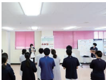
院内学会 ポスターセッション

心理的安全性とは「チームメンバーが互いに気兼ねなく意見を伝え合い、協力し合い、自分らしくいられる状態」のことです。チームメンバーそれぞれが、素直に発言・提案でき、意見がぶつかることに恐怖がない、間違いを発見したら指摘し、話し合える職場をめざしています。