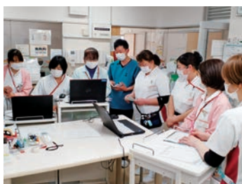
みんなでスキルアップ

地域の方々が住み慣れた地域で安心して暮らしていけるよう院内外が多職種と連携をとりながら、日々患者さんの声に耳を傾け、誠実で丁寧な看護を心掛けています。