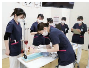
技術の実践能力向上を目指します

ジョブローテーションにより、様々な部署で業務を体験し自分に適した部署を見つける事が出来ます。1人1人の良さを引き出し、その後のキャリア形成の方向付けをすることも可能になります。自分の強みを生かし、看護を楽しみながら長く勤める事が出来る事を目標にしています。