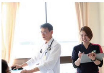
毎日、医師と回診し情報共有します