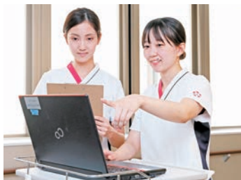
相談しやすい環境で主体性のある看護を実践

あらゆる人々に医療・福祉の手を差しのべる「済生」の精神を念頭に置き、活き活きと働くなでしこナースとして私たちの仲間入りをお願いします。