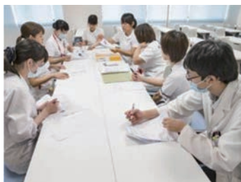
他職種との活発な委員会

【看護部の理念】「1.信頼できる看護」「2.信頼される看護」「3.自信のある看護」を目指します。