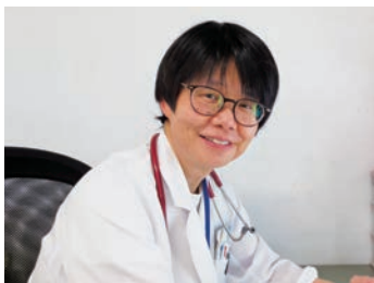
お待ちしております！

私たちは「私たち自身が受けたい医療及びサービスを提供いたします」の理念の下、5つの実践目標を掲げ、日々質の向上に取り組んでいます。近年は、中でも患者様の尊厳を尊重する医療のため、患者様・スタッフの笑顔のため、多職種での協働を行っています。