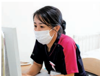
今日も元気に頑張るぞ!

入職後1年はプリセプターの先輩が基本的な看護技術や部署内の業務について1対1でしっかりと教えて下さいます。技術についてはどの先輩にも質問しやすい環境ですが、特にプリセプターの先輩は悩んでいる時等に気さくに声をかけて下さり、精神面でも安心して働くことができます。