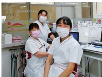
働きやすい職場です

看護部委員会ごとに企画した勉強会を定期的に行い、スキルアップにつなげています。また、専門職として成長するために、Web研修の受講や院外研修会への参加などを積極的に勧めています。