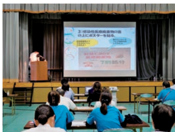
研究発表会 ～成長した今の自分の集大成～

当院は、精神科・認知症医療専門の精神科病院です。疾患経過や症状別で構成される病棟は、それぞれ特殊性をもち、それに応じて、多職種チームが協働し、きめ細かな働きかけを行っています。また、退院後も、安心して在宅生活の継続ができるよう、デイケアや訪問看護、小規模多機能型居宅介護などと連携しています。河田グループでは、認定こども園や特別養護老人ホーム、サービス付高齢者向け住宅、美術館等を運営しており、赤ちゃんからお年寄りまで、地域の方々の心の健康づくりに貢献しています。