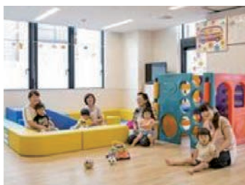
安心の院内託児所

新病院は1階に託児所があり便利です。短時間勤務制度や2交代制で残業時間も少ないため、子育て世代でも働きやすい環境が整っており、仕事と家庭の両立ができ、安心して働けます。