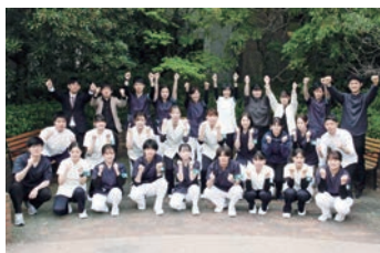
新任者集合! 仲間とともに!

看護教育としては、新任者研修を始め、フィジカルアセスメントや医療安全、精神科における専門性を高める研修等、ナーシングスキル動画講義・集合研修・OJTを充実させ育成に努めています。