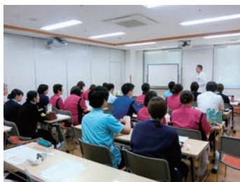
ランチョンセミナー

当院は、旭川の河口の岸に位置する219床の精神科病院です。病院の理念に基づき、患者様にはこころの通い合う温かい看護の提供を通して、顧客満足度を高めるよう努めています。また、「笑顔でイキイキ働き続けられる職場づくり」を目指しています。1時間ごとに有給休暇が取得できるようになったのも取り組みの成果です。職員が仕事と子育てや介護、自己の価値観を見つめ直し、日々自己成長できる人材が育つ職場を目指しています。