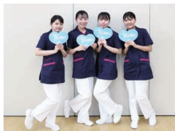
多職種を含め多くの人と出会えます

これからの医療の中心となる回復期。当院は、回復期・在宅支援を中心として安心して退院出来る、退院した後もしっかりとサポートできるトータルケアを目指しています。看護部は、「あなたらしさを支え続ける」を看護理念とし、地域共生社会・地域包括ケアシステムに対応した間口の広い柔軟な看護と、一人一人の暮らしを支える看護を大切にしています。