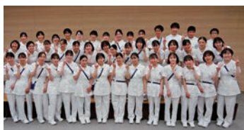
一緒にがんばりましょう

全国赤十字91施設で導入されているキャリア開発ラダーに基づき、看護実践能力のレベルを意識しながら能力開発することを目指しています。そして、新人から段階的に学び、成長していけるよう支援体制をとっています。