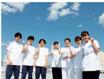
チームで地域の“運動器”をトータルサポートします！

当院は地域と歩む整形外科単科病院として、急性期から在宅復帰までを担い、地域医療の向上に努めています。急性期病棟、回復期リハビリテーション病棟、地域包括ケア病棟を有し、チーム医療による患者さん一人おひとりに合わせた治療・看護・リハビリテーションの提供を行うことにより、患者さんが一日でも早く健康で過ごされていた頃に近づくことを目指して支援しています。また、患者さんや地域の方々、医療スタッフを引きつけるような魅力ある病院づくりを行っています。