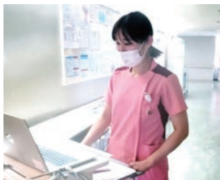
ママさんナース、活躍中です!

当院では育児や介護、病気などがあっても働き続けられるよう、みんなで協力して残業にならない配慮や急なお休みに対応しています。様々な世代に優しい風土を大切にしています。