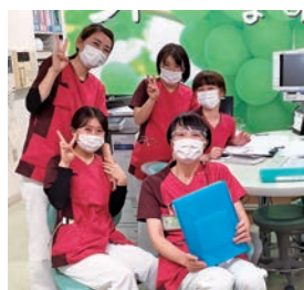
先輩が、いつも笑顔で迎えてくれます