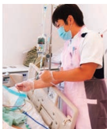
集中ケア認定看護師

また、現場教育にも力を入れており、看護師としての専門的知識や技術をもとに、患者さんに尊厳ある看護を提供できる看護師に成長していくことができます。