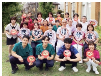
未来の医療従事者育成チーム!! 「きびドリサポ」

一人ひとりを丁寧に支援し、共に学びを深めあうプリセプター制を導入しています。仕事と育児の両立ができるよう、育児休業や時短勤務制度、リフレッシュ休暇など就労支援にも尽力しています。やりがいのある職場で、共に成長できる事間違いなし！