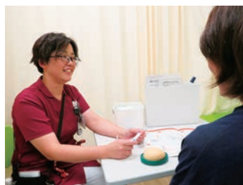
認定看護師による患者指導

当院は、日本看護協会のクリニカルラダーを導入しています。また、「新人看護師教育スケジュールパス」を作成して研修を行っています。おおらかに教えあい、育てあい、認めあい、支えあうという「4つの愛♡」四つ葉のクローバーをマインドに、新人看護師をみんなでサポートしています。