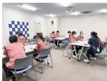
ラダー研修の風景

当院は「より良い医療を地域の人々に」を理念に掲げ、身近でいつでも安心して受診できる「かかりつけ病院」として医療を提供しています。また、高齢化に伴い急増するがんと心臓疾患の診断と治療に力を入れています。そのため看護師には、専門的知識と技術、そして安心できる対応が求められます。看護部では、患者さんとその家族、そして一緒に働くスタッフ、すべての人に笑顔で、思いやりのある看護を提供したいと考えます。一心堂は、一緒に働く仲間を募集しています。ぜひ一度、病院見学にお越しください。