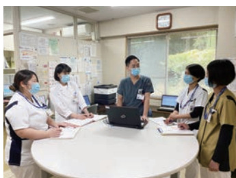
職員間の意見交換を大切にしています

当院は岡山市中心部から北西に位置し、緑に囲まれた静かな環境にある病院です。医療療養病床60床を有し、近隣の各医療機関との連携を図りながら、地域に根ざした後方支援病院としての役割を担っています。看護部は、「患者様の生き方・心を大切に考え、誠実に対応することに努め、『安全』『安心』『満足』を提供いたします」を基本理念とし、個々の患者様に寄り添った、質の高い看護を目指しています。