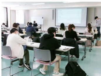
全体学習会を毎月実施しています

学会などの研修会の参加を積極的に支援します。また、学会の会費の補助も行っています。2019年度に誕生した当院初の精神科認定看護師を中心に、専門職として職員全体でスキルアップできるよう、院内での学習会も充実させています。