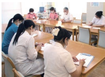
月に1回の、他職種カンファレンス

看護部は「人にやさしく、心が伝わる看護を実施します」を理念とし、患者さんに寄り添った看護をめざし、穏やかな療養生活を送れるように努めています。