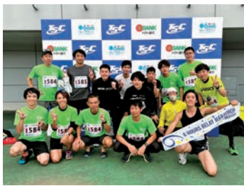
マラソンで仲間とともに健康増進・体力向上

キャリア開発ラダーによる教育体制、多職種との共同勉強会、eラーニング研修、院内外研修への参加や各種資格取得のバックアップ体制等があり積極的に学べます。人事評価制度を導入し、目標管理、面談により職員ひとりひとりの自己実現や目標達成を支援しています。