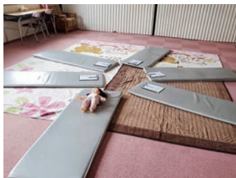
月に一度の育児サークルは好評いただいております