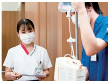
豊富な学びの機会ですキルアップ

日々の業務の中で、新人看護職員はPNSにより先輩の知識・技術を目の前で学び、リアルタイムで相談できます。お互いに尊重し助け合ってより良い看護を提供しています。