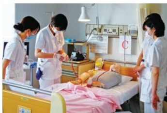
新人看護職員 看護技術研修(静脈注射)

救急医療、がん診療を二本柱として、質の高い医療を提供しています。また災害医療も赤十字の使命であり、岡山県の基幹災害医療センターとして対応できる体制を整えています。若いスタッフも多く、活気があり、お互いに刺激し合い、助け合って仕事ができる環境です。これからの赤十字の原則である「人道」を基本に患者を尊重し、心がかような医療・看護が提供できるよう努力していきます。