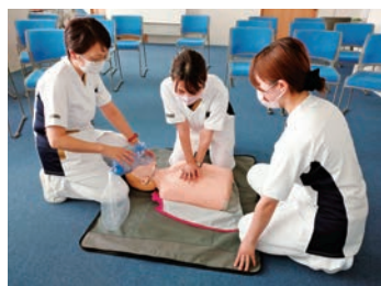
BLS研修受講で急変対応ができる看護師に!

「心のこもった最高の医療提供」という病院基本方針のもと、段階に応じた教育の充実を図り、スタッフが心と体の健康を保ちながらレベルアップできる環境づくりを目指しています。