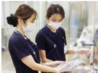
PNS ® による支援体制

当院の育成したい看護師像は「温かい手、やさしいまなざしで患者さんと共に歩む知的な看護」を実践する看護師です。看護師一人ひとりが、自ら考え、自律的に成長できるようにシミュレーション研修や現場教育により、共に学ぶ姿勢を大切にしています。