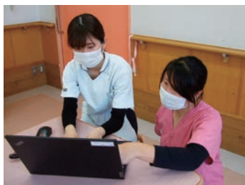
電子カルテの個別指導

当院は岡山市の南、児島湾に面した自然豊かな地にある認知症の人専門に医療を行っている精神科の病院です。「認知症の人がその人らしく生きることができるよう援助します」を理念に、認知症医療・ケアの提供をしています。入院部門では、認知症のBPSDが改善し、穏やかに過ごせるよう多職種チームで関わっています。中でも介護福祉士を多く配置し、協力して「認知症ケア」を追求しています。外来部門では、様々な相談活動、訪問看護、認知症デイケアで在宅支援を行っています。