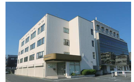
※ナースセンターは研修センターの3階にあります。