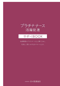
プラチナナース活躍促進サポートBOOK

「プラチナナースサポートセンター(岡山県ナースセンター内)」に登録されると、活躍できる場をコーディネートします。