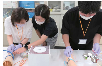
職場復帰のための看護技術講習会