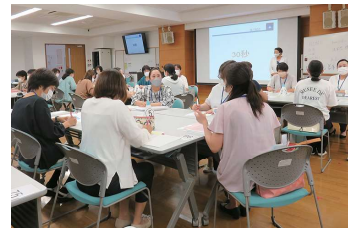
訪問看護師養成講習会