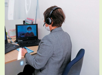
岡山県ナースセンターでの就業相談

※電話、メール、オンラインでも相談できます。 ※県下各地域で就業相談を行うこともあります。