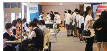
看護進路ガイダンス