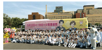
「看護の日・看護週間」ラッピングバス