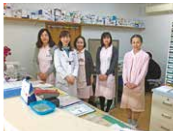
クリニックスタッフ

患者さまやご家族とふれあい、地域の方々一人ひとりに寄り添いながら看護を行っています。患者さまの病状、家族背景など様々な情報を共有し、患者さまの視点にたった支援ができるよう努めています。