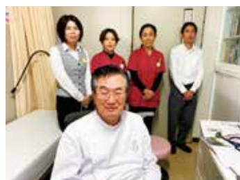
アットホームな職場です

当院は、有床診療所(19床)として、在宅療養支援診療所・救急告示医療機関・肝炎一次専門医療機関の認定も受けており、地域連携バス(大腿骨頸部骨折・脳卒中)、がん診療連携や人工透析・CAPD・大腸内視鏡・胃内視鏡・禁煙外来の診療も行っています。また、在宅医療や訪問診療を積極的に行い、リハビリによる骨折予防をはかり、在宅復帰率を上昇させるとともに、病診連携、医療介護多職種連携のもとに、地域包括ケアの実現をはかり、患者様が安心して生活出来るよう見守っていきます。