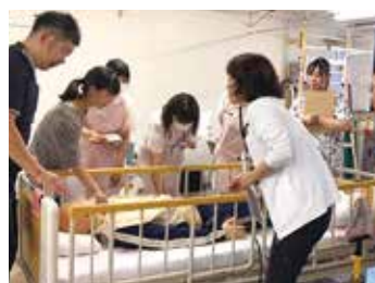
院内勉強会でのワンシーン