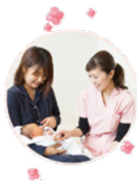
入院中の患者様との関わり

私達は母乳育児を通じて母子の愛着形成をサポートしております。母乳を中心にミルクを上手に使い、赤ちゃんにとって何が大切なことかを考え、赤ちゃんとママに寄り添うことを心がけております。