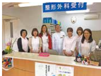
みんなで力をあわせて

患者さんやご家族とふれあい、地域の方々一人ひとりに寄り添いながら看護を行っています。患者さんの病状、家族背景など様々な情報を共有し、患者さんの視点にたった支援ができるよう努めています。