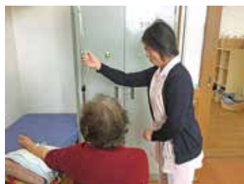
ふれあいを大切に

当院は倉敷市の児島地区にあります。兄弟クリニックモールという形態で診療を行っており、3兄弟の医師(男性2名、女性1名)がそれぞれ整形外科、内科、耳鼻科を担当しています。受付は整形外科と内科耳鼻科で別々になっています。広々とした清潔感あふれる職場で、心のもったケアと安心・安全な医療を提供できるよう、職員みんなで日々奮闘しています。