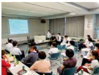
他職種合同ミーティング

〈医療の原点はやさしさ〉を基本理念として、赤ちゃんから高齢者まで、地域における家庭医療と各種専門医療の担い手であり、岡山における在宅ホスピスのオピニオンリーダー。