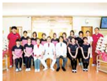
スタッフ同士アットホーム

新人の方、ブランクのある方、経験問わず実践を通して個々の成長に合わせた指導を行っています。スタッフ同士仲が良くアットホームなのでとても働きやすい職場です。