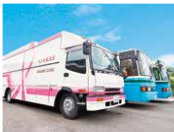
検診車で巡回健診へ

当診療所は、医師・看護師等スタッフ全員で受診者様の情報を共有し、受診者様を第一に考えた対応を心がけています。職員はお客様に常に笑顔で接し何を考えているか、どうすればご希望に添えるかを考え、連携をとりながら診療や人間ドックをはじめとした健康診断に取り組んでいます。看護部門では、採血や様々な処置を行う際、受診者様に寄り添っていけるよう他部門と連携を取り満足していただけるよう努めています。また、当診療所は、医師・看護師を含め5~6人で契約事業所様へ訪問しての検診バスで巡回による健康診断を行っています。