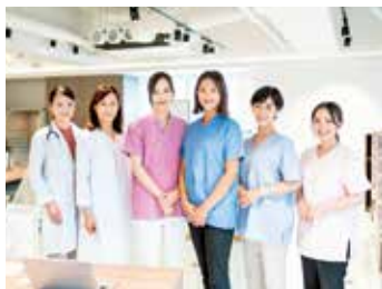
健康を支えるスタッフ、一緒に働きましょう

大ヶ池診療所は、検診車による巡回健診を実施する機関です。健診は日々違う場所で実施し契約事業所様それぞれの要望に合わせた健診を行っています。