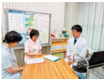
カンファレンス風景

慢性腎不全患者さんの円滑な透析療法への導入、長期維持を医師・看護師・臨床工学技士・管理栄養士・事務職員等全てのスタッフの力を集結して支援します。