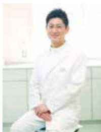
一緒に地域医療に貢献しましょう!

「地域の健康の為にできること、全てを。」を理念に掲げ、内科をはじめ、予防医学の知識とスキルを駆使して、地域の健康を支え続けていきます。職場環境は、ご家族との時間を大切に出来る環境、子育てしやすい環境を実現。一例として、看護師さんが多く在籍、突然のお休みや旅行など長めの休暇を気兼ねなく取りやすい体制になっています。有給休暇6日間連続取得により、最長8日間の休暇が可能。子育て支援など福利厚生も充実しています。みんな仲良く輝いている職場です。詳しくはHPを検索。