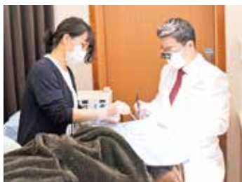
外来手術のイメージ

開院して14年が経ちました。アットホームな雰囲気職場環境です。看護業務内容は皮膚科疾患の診察の介助と処置です。フットケア外来における足の健康指導や紫外線治療器による光線療法。形成外科手術(眼瞼下垂・皮膚癌切除と再建など)の直接・間接介助と周術期管理。最近では美容皮膚科(シミ取り・アンチエイジング・脱毛)の施術が多くなっています。スタッフが多く、専門性が高い医療を提供できています。ひとりひとりの患者さんの不安を減らし、期待に応えられるような医療・看護を目指しています。