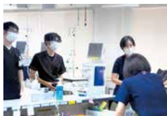
アットホームな職場です

患者さまが、不安やストレスなく、心地よく過ごしていただくとともに、ご家族にも安心して任せていただけるよう、細やかな気配りとコミュニケーションを大切に、日々の看護を行っています。