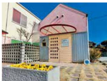
病児保育室みらい

検査や薬を増やすばかりの一面倒ではなく、問診や診察の結果に応じて、お子さん一人ひとりに必要なケアを考えます。