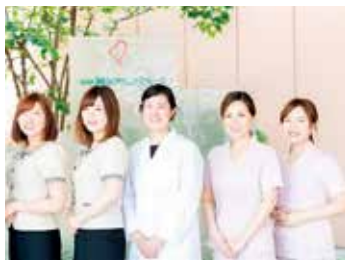
まつい皮ふ科 スタッフ

美容に関心のある方(メディカルエステ)、気配りの利いた対応を心掛けて真剣に取り組んでくださる方、ぜひ、一緒に働きましょう。