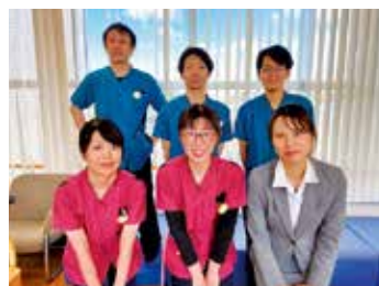
一緒に働きましょう

有床診療所として、救急の受け入れとともに、地域の施設と連携を密に行い、地域医療を中心とした看護を行っています。一人一人の患者様、ご家族様に、肉体的・精神的・社会的なトータルの支えができる人間づくりをしています。