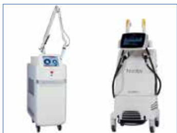
ピコレーザーとIPLノーズ

患者さんの周術期における不安や苦痛を和らげます。手術中はリラックスできるようにBGMが流れ、声かけなどによって患者さんに安心していただきながら、手術のスムーズな進行を心がけています。