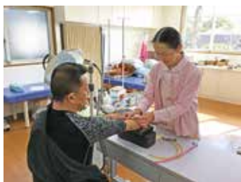
患者さまとふれあい寄り添いながらの看護業務

地域の「かかりつけ医」として、親切でやさしい医療をこころがけています。生活習慣病や慢性疾患の治療、胃カメラやエコーなどの検査、往診や在宅医療に力を注いでいます。糖尿病については、「総合管理医(かかりつけ医)」として、専門医療機関と密接に連携しながら、患者さまごとに丁寧な診療を行っていきたくと考えています。