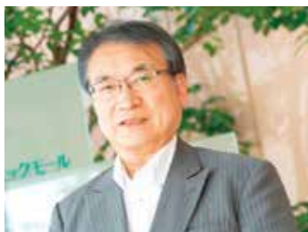
まつい皮ふ科 院長

医療を通じ、地域の方々に交流の場、ふれあいの場を提供することで、特に高齢者のフレイル改善につなげ、健康寿命の延伸に貢献する活動をしています。