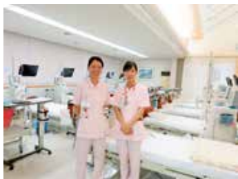
クリニックスタッフ

患者さんのデータ等異常があれば、院長・看護師・管理栄養士で相談をしています。また、近隣の病院で検査紹介等行っています。